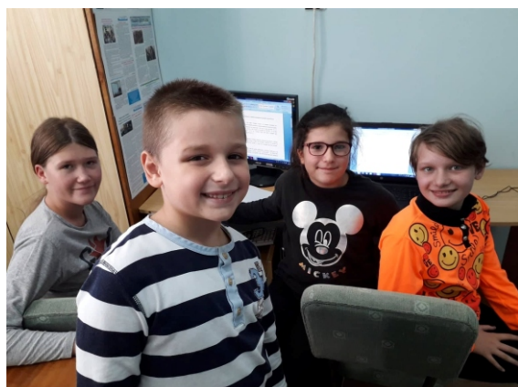
К л у б „Журналист“

Освен това яздих кон, когато бях на почивка със семейството ми и наши приятели.